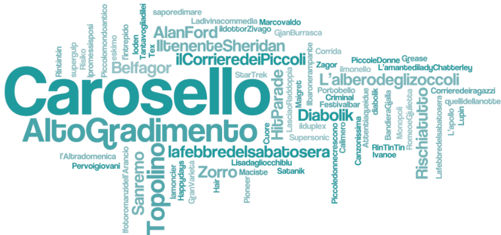
Mappa mediale generazione "Boomers"

Per quanto riguarda la complessificazione del panorama mediale è sufficiente comparare le mappe dei prodotti generazionali ricostruite per la generazione dei "Boomers", per la generazione "Neo" e per quella "Post" per vedere, oltre che un ovvio cambiamento dei prodotti mediali di riferimento, un affollamento di prodotti mediali all'interno della mappa. Se infatti la mappa dei prodotti mediali dei "Boomers" mostra un numero tutto sommato limitato di prodotti a fare da sfondo ai grandi puntatori della memoria mediale generazionale (in questo caso il Carosello televisivo e il programma radiofonico Alto gradimento ) il numero assoluto dei prodotti riportati cresce con i "Neo", fino a toccare il massimo con i "Post". Se è vero che, all'interno di questi panorami mediali, è poi possibile individuare una serie più limitata di prodotti in grado di essere veri propri catalizzatori dell'esperienza e della memoria mediale generazionale, è innegabile osservare come il panorama mediale che ha accompagnato la fase formativa dei "Boomers" fosse in qualche modo più "semplice", nel senso di una rilevanza "universalistica" dei prodotti mediali che svolgevano – e continuano a svolgere – la funzione di puntatori largamente condivisi dalle memorie collettive di quella coorte. Un dato evidente se confrontato, per esempio, con la fisionomia frammentaria e dialettica che caratterizza le mappe mediali relative alla fase formativa della coorte dei "Post".